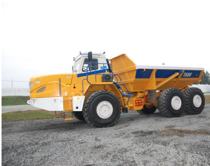
Самосвал повышенной проходимости МОА3-7506 на испытательном полигоне ОАО «БЕЛАЗ»

Специалисты предприятия ведут активную работу над расширением линейки подземной техники, техники повышенной проходимости. Планируется провести приемочные испытания опытного образца и изготовить опытно-промышленную партию самосвалов с шарнирно-сочлененной рамой грузоподъемностью 50 тонн; изготовить опытно-промышленную партию и выдать на подготовку производства конструкторскую документацию на самосвал-землевоз грузоподъемностью 36 тонн; изготовить опытный образец и провести типовые испытания самосвала-землевоза грузоподъемностью 25 тонн с двигателем Scania; изготовить опытно-промышленную партию машины погрузочно-доставочной грузоподъемностью 16 тонн.