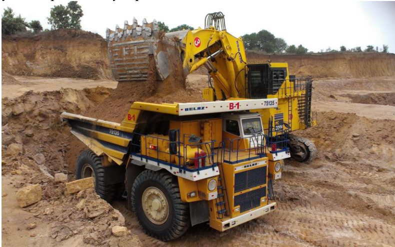
Карьерный самосвал БЕЛАЗ-75135 грузоподъемностью 110 тонн

С 1990 года БЕЛАЗ значительно расширил гамму выпускаемой продукции, включив в нее карьерные самосвалы нового поколения грузоподъемностью 55, 130, 160, 170, 220, 240, 360 тонн, а также спецтехнику — погрузчики, бульдозеры, тягачи-эвакуаторы, поливооросительные машины, машины для металлургических предприятий и другую технику, востребованную рынком.