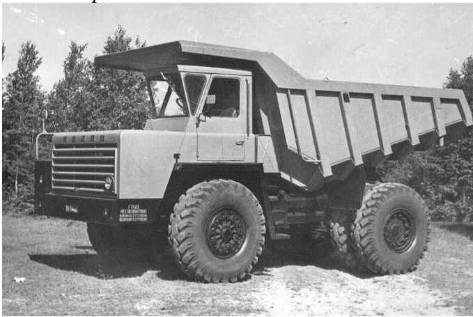
Первый 27-тонный самосвал БЕЛАЗ-7540

Предприятие основано в 1948 году, а в 1958-м получило имя «Белорусский автомобильный завод». В 1960 году здесь приступили к проектированию «БЕЛАЗ» — самосвалов принципиально новой конструкции для разработки месторождений полезных ископаемых открытым способом.