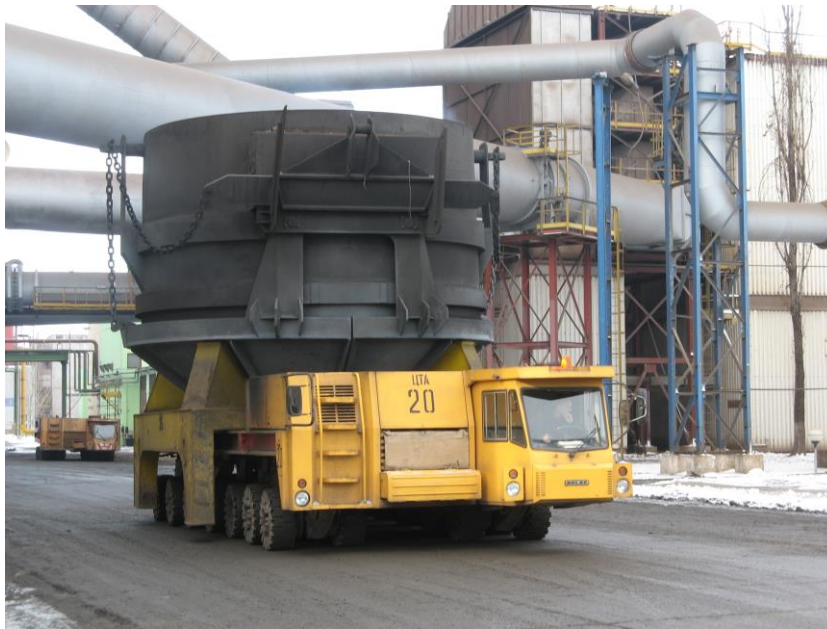
Тяжеловоз БЕЛАЗ-7926 грузоподъемностью 150 тонн

- машины специального назначения: катки самоходные, мусоровозы, аэродромные тягачи, электрокары.