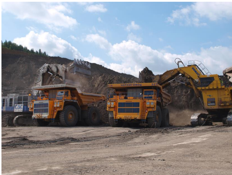
Карьерные самосвалы серии БЕЛАЗ-7530 грузоподъемностью 220 тонн