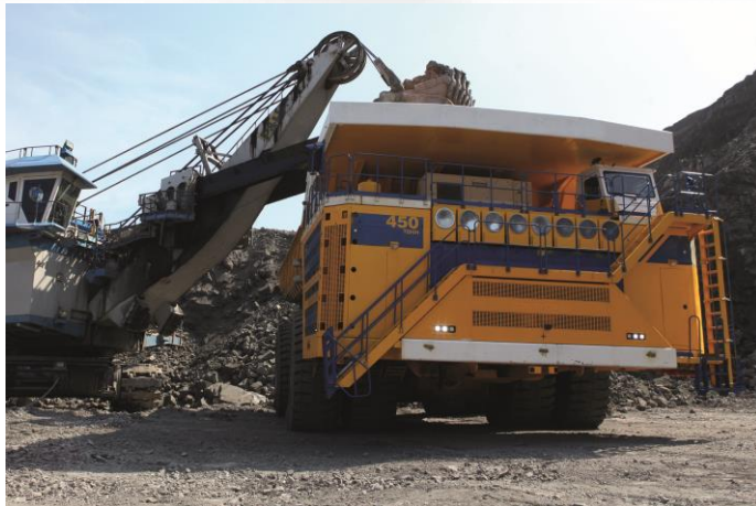
Карьерный самосвал БЕЛАЗ-75710 грузоподъемностью 450 тонн