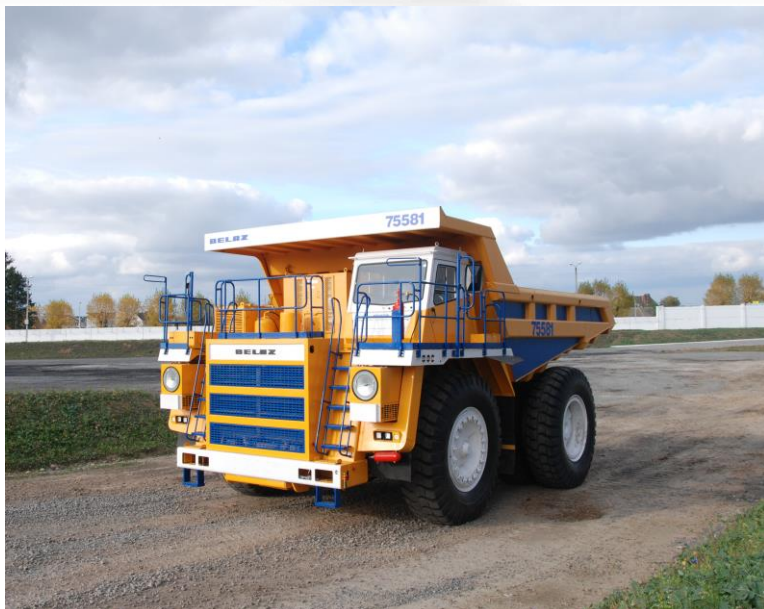
Новый карьерный самосвал БЕЛАЗ-75581 грузоподъемностью 90 тонн

Специалисты предприятия ведут активную работу над расширением линейки подземной техники, техники повышенной проходимости. Планируется провести приемочные испытания опытного образца и изготовить опытно-промышленную партию самосвалов с шарнирно-сочлененной рамой грузоподъемностью 50 тонн; изготовить опытно-промышленную партию и выдать на подготовку производства конструкторскую документацию на самосвал-землевоз грузоподъемностью 36 тонн; изготовить опытный образец и провести типовые испытания самосвала-землевоза грузоподъемностью 25 тонн с двигателем Scania; изготовить опытно-промышленную партию машины погрузочно-доставочной грузоподъемностью 16 тонн.