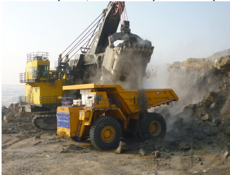
Карьерный самосвал серии БЕЛАЗ-7531 грузоподъемностью 240 тонн в карьере «Силинхот» (Китай).

За январь-октябрь 2015 года продукция ОАО «БЕЛАЗ» поставлена в 26 стран, в т.ч. 16 стран дальнего зарубежья: Вьетнам, Монголия, Болгария, Сербия, Босния и Герцеговина, Польша, Ангола, Марокко (последние 2 страны – новые рынки) и др.