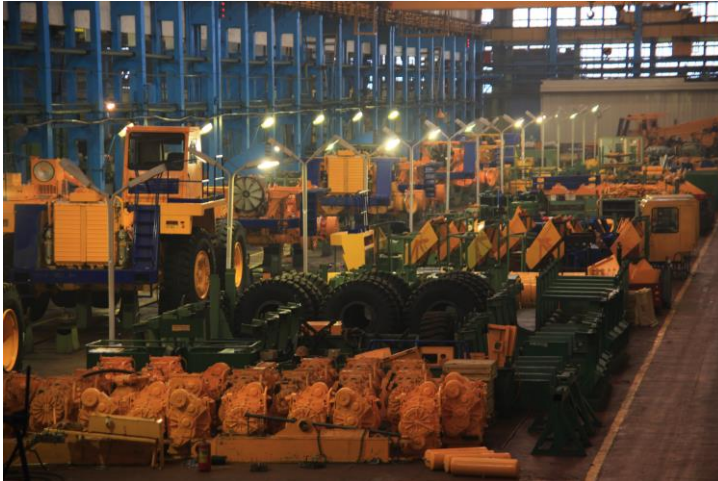
Цех главного конвейера по сборке самосвалов грузоподъемностью от 30 до 60 тонн

Проектирование и разработка карьерной техники нового поколения и доработка конструкции серийно выпускаемых машин ведутся на базе научно-технического центра предприятия, объединившего в своем составе управление главного конструктора ОАО «БЕЛАЗ», отдел подземной и дорожно-строительной техники, осуществляющий конструкторское сопровождение производства в филиале БЕЛАЗа - на Могилевском автомобильном заводе, экспериментальный цех и испытательную лабораторию. Сегодня БЕЛАЗ имеет высокотехнологичные рабочие места конструктора и технолога, позволяющие вести трехмерное проектирование и технологическую подготовку, что значительно ускоряет процесс создания новой техники. Прочностные расчеты, произведенные на этих станциях, обеспечивают надежность будущей машины уже на стадии ее проектирования.